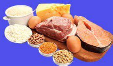
Красное мясо, жиры и углеводы