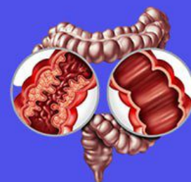
Воспалительные заболевания кишечника