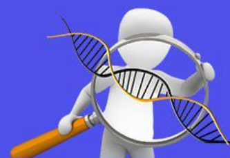
Семейный анамнез и наследственность