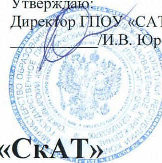
ГРАФИК РАБОТЫ ВОЕННО-ПАТРИОТИЧЕСКОГО КЛУБА «СКАТ» на 2020-2021 учебный год